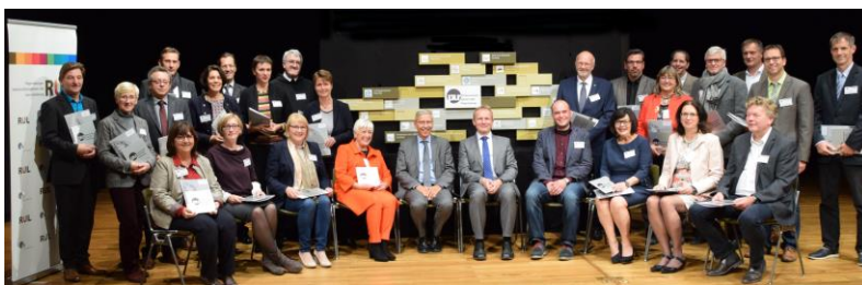
Ein neu geschaffenes Wandrelief, das an einer zentralen Stelle im Audimaxgebäude der Universität angebracht wird, symbolisiert die für alle bereichernde Heterogenität der im Schulnetzwerk vertretenen Schulen.