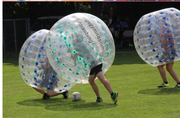
Klasse 9c – Sieger der 1. Luggy-Bubble-Ball-Meisterschaft!