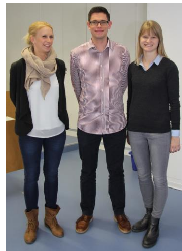
Neue Lehrkräfte seit Februar 2017