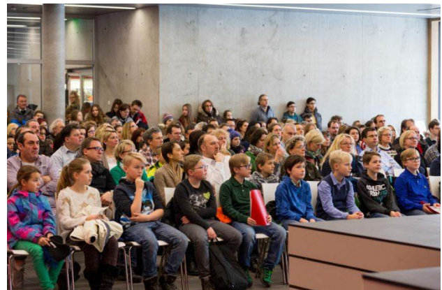
Die neue Aula bewährt sich bestens als Veranstaltungsraum

Zuvor schon konnte die Stadt Straubing am 13. Januar 2017 mit einem großen Festakt den Teilneubau am Ludwigsgymnasium mit der neuen Aula und den naturwissenschaftlichen Fachräumen einweihen. Vielleicht hatten Sie schon eine Gelegenheit, die neuen Räumlichkeiten in Augenschein zu nehmen, eine erste Möglichkeit dazu bot sich am 14. Januar 2017, an dem wir mit einem Aktionstag für unsere Schülerinnen und Schüler und mit sehr großem Engagement zahlreicher Lehrkräfte den Teilneubau offiziell in Betrieb genommen haben. Seitdem findet zum einen tagtäglich der Unterricht in den Fachräumen statt, zum anderen hat sich die Aula mit ihrer flexiblen Bühne schon bestens bewährt, z. B. bei den sehr gelungenen Aufführungen unserer Theatergruppe, bei den hervorragenden musikalischen Darbietungen zu den verschiedensten Anlässen oder bei diversen Veranstaltungen, Projekten und Vorträgen für unsere Schülerinnen und Schüler.